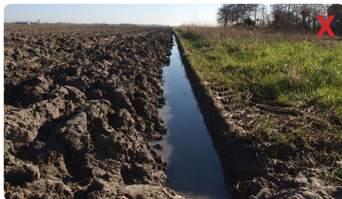
Stagnerend water op de ploegzool door ondergrondverdichting. Dit veroorzaakt structuurbederf en opbrengstverlies van het gewas.

Door de ondiepere beworteling kan de beregeningsbehoefte verdubbelen, waardoor de grondwatervoorraad sterk wordt aangesproken. De grondwaterstand wordt door ondergrondverdichting onvoldoende aangevuld. Drains lopen niet door deze diepe grondwaterstanden.