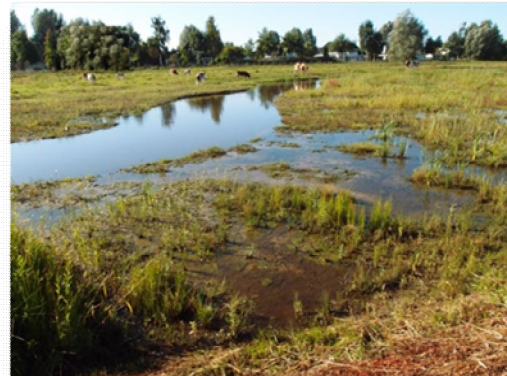
Foto 1 -Bermen kleuren van geel naar wit,

Foto 2 -Onlangs herstelde Bakelse Aa, waterberging, natuurontwikkeling en recreatie.