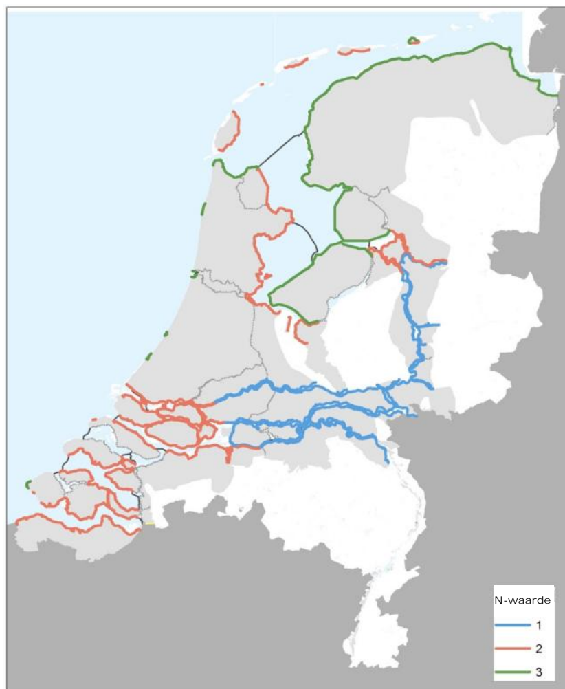
Figuur 2: N-waarden per dijktraject.

De N-waarde is een maat voor het lengte-effect bij overslag (zie hoofdstuk 2).