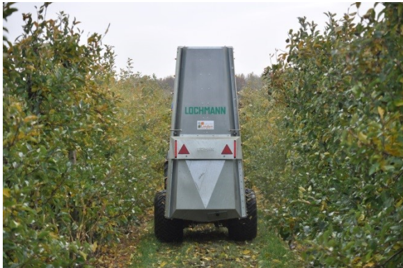
Figuur 1 Lochmann NL dwarsstroomspuit met Air Closing System (ACS).