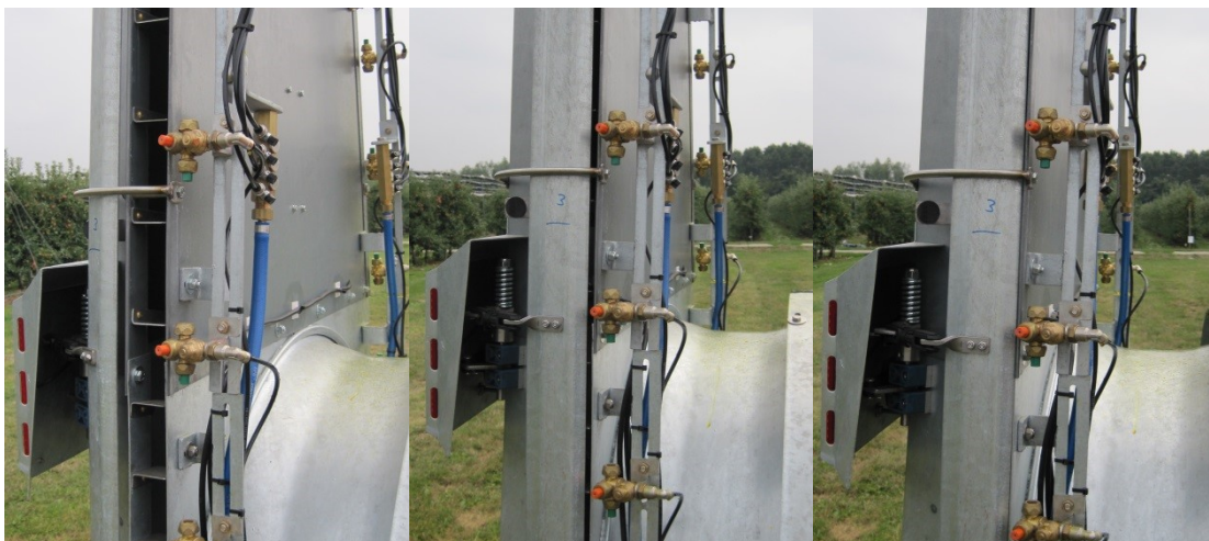
Figuur 3 Klepstanden van het Air Closing System bij de luchtklepinstelling OPEN (links), 80% dicht (midden) en DICHT (rechts).