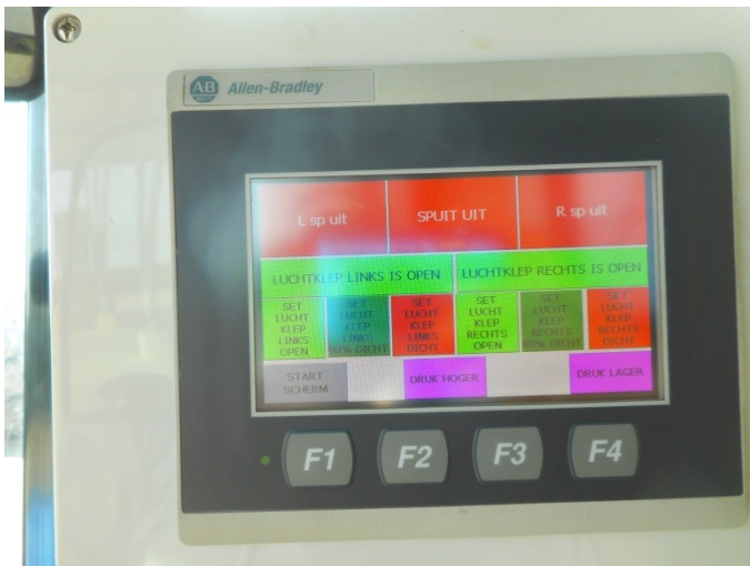
Figuur 2 Scherm van spuitcomputer met touchscreen met daarop per spuitrichting (links en rechts) knoppen voor de bediening van de luchtklepinstelling: OPEN (lichtgroen), 80% dicht (donker groen) en DICHT (rood).