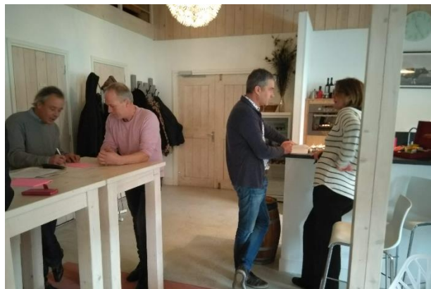
Deelnemers bedenken werkwijzen voor versnellen