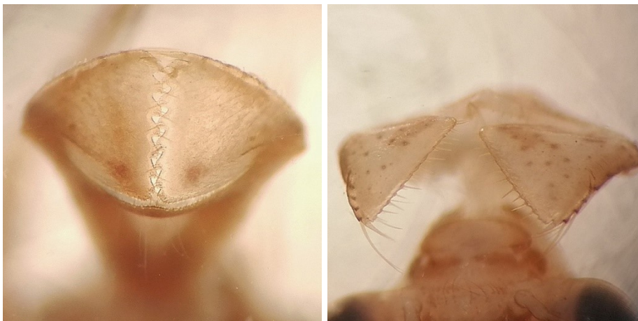
Figuur 6. De insnijdingen van de labiale palp van een jonge larve van C. aenea (links, kopbreedte 1.3mm) en S. sanguineum (rechts, kopbreedte 1.7mm). De larve van C. aenea van deze foto had tevens nog kleine hoorntjes op de vertex, maar duidelijk kleiner dan die van S. sanguineum van figuur 2.

Met veronachtzaming van de hoorntjes op de vertex sleutelen de mysterieuze larven op grond van de lengte van de eerste twee antenneleden en de insnijding van de labiale palpen ook uit op Libellulidae.