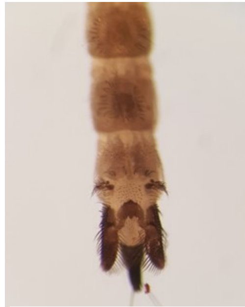
Figuur 1: Achterkant van Dixa puberula dorsaal.

De eieren van Dixidae worden afgezet op hard substraat of in organisch materiaal. Vervolgens zijn er vier larvale stadia in het water, waarna ze verpoppen. De larven zijn filteraars (Ivkovic 2019). Ze zijn zeer karakteristiek, met aan de achterkant een staartaanhangsel en twee peddels (fig. 1). Larven van Dixa hebben een voorkeur voor stromend water (met uitzondering van Dixa nebulosa ), terwijl larven van Dixella in stilstaand en langzaam stromend water voorkomen. Ze kunnen het hele jaar gevonden worden. In beken zijn larven van Dixa uiterst gevoelige indicatoren voor de vervuiling van het oppervlaktewater. De volwassen dieren vliegen van maart tot en met december en zijn te vinden in de buurt van het biotoop (Ivkovic 2019).