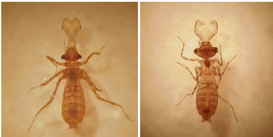
Figuur 3. Habitus van een jonge larve van C. aenea (links, breedte occiput 2.0mm) en van een jonge S. sanguineum (rechts, breedte occiput 1.7mm).