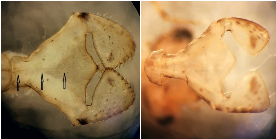
Figuur 4. Basis van het prementum met een middengroef ( C. aenea , links) en zonder middengroef ( S. sanguineum , rechts).

De eerste conclusie is dan ook dat de mysterieuze larven geen Corduliidae kunnen zijn! Hoe zit dat met andere kenmerkende verschillen tussen Corduliidae en Libellulidae?