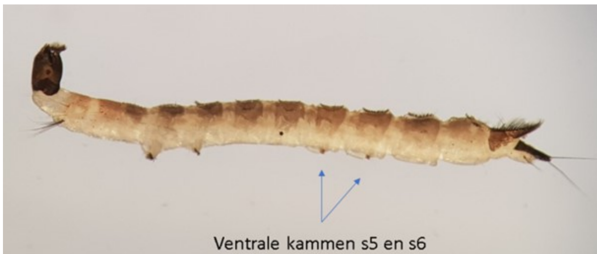
Figuur 2: Dixa puberula met ventrale kammen op segment 5 en 6.