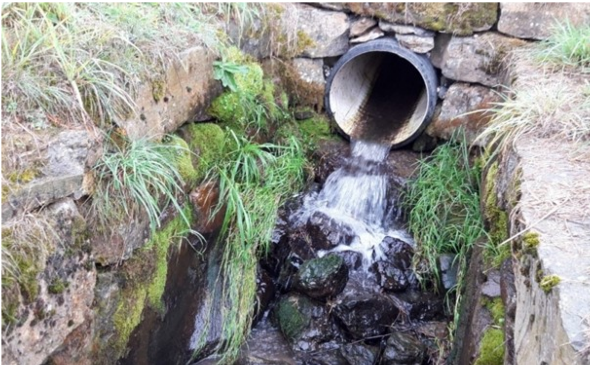
Figuur 3: Vindplaats van Dixa puberula , ten noorden van de Oude Akerweg bij Lemiers.

De Hermansbeek is een smal heuvellandbeekje. Op de vindplaats, op 167 m boven N.A.P., is de beek ongeveer 1 m breed en 10 cm diep. De beek wordt er door een buis geleid en het water stroomt ter plaatse over stenen.