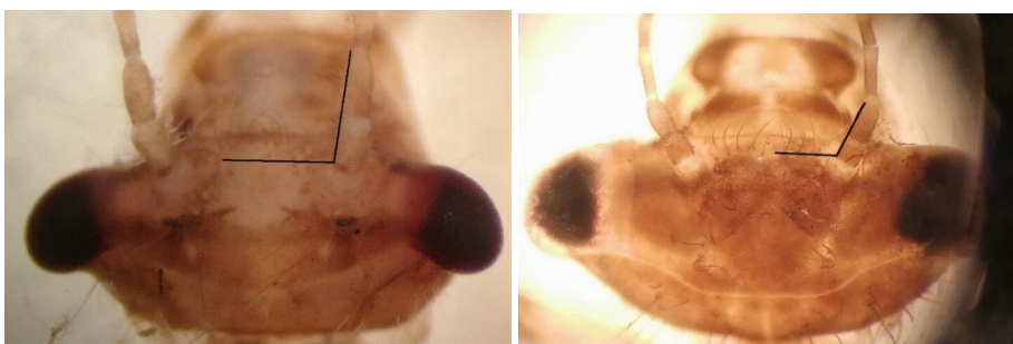
Figuur 5. Lengte van de eerste twee antenneleden t.o.v. de middellijn tussen de ogen voor een jonge larve van C. aenea (links) en S. sanguineum (rechts). Tevens zijn op de foto rechts de twee hoorntjes net boven de witte dwarslijn te zien.

Norling & Sahlén (1997) geven in hun tabel, als enige, voor veel soorten onderscheidende kenmerken voor zowel oude als ook jonge larven. De tabel is dan ook de meest geschikte om de mysterieuze jonge larven verder te analyseren. De door hen gebruikte kenmerken worden hieronder behandeld. Voor Corduliidae is de totale lengte van de eerste twee antenneleden groter dan de afstand van de antennebasis tot het midden tussen de antennes. In kleine larven is de relatieve lengte van de eerste twee antenneleden zelfs nog groter. Voor Libellulidae geldt dat de lengte van de eerste twee antenneleden korter is dan de afstand tussen antennebasis en het midden tussen de antennes. In kleine larven kan het midden tussen de antennes worden bereikt of iets worden overschreden. Voor de mysterieuze larven geldt dat de lengte van de eerste twee antenneleden zo groot is als de afstand van de antennebasis tot aan het midden tussen de antennes (figuur 5 rechts). Voor jonge en oude larven van C. aenea die in dit project zijn verzameld, geldt dat de lengte van de eerste twee antenneleden duidelijk groter is dan de afstand van de antennebasis tot aan het midden tussen de antennes (zie figuur 5, links).