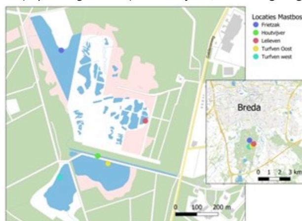
Figuur 1. Overzicht van de bemonsteringsplekken in het Mastbos bij Breda.

Op 5 mei 2020 zijn door Hein van Kleef (Stichting Bargerveen) op meerdere plekken watermacrofauna-monsters genomen in het Mastbos bij Breda (figuur 1). In dit vennencomplex zijn in november 2013 achthonderd snoeken ( Esox lucius ) uitgezet om de vraatzuchtige en massaal voorkomende Zonnebaars ( Lepomis gibbosus ) te bestrijden, of beter gezegd, in te tomen.