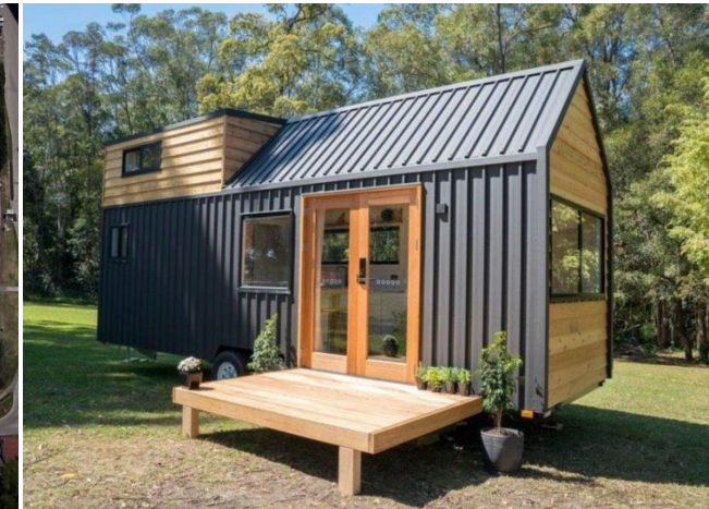
Tiny house voor een gezin