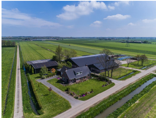
Agrarisch bedrijf wijzigen