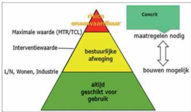
FIGUUR 3: AFWEGINGSRUIMTE GEMEENTEN BIJ BOUWEN OP BODEMGEVOELIGE LOCATIES.

ring. Dit kunnen rechtstreeks werkende regels zijn of instructie-regels aan gemeenten. Via deze decentrale regels kan een initiatiefnemer verplicht worden om bij een voorgenomen ontwikkeling of activiteit aanvullende maatregelen te nemen ter verbetering van de grondwaterkwaliteit. Daarbij kun je denken aan een verplichte bronaanpak of het uitvoeren van een grond-