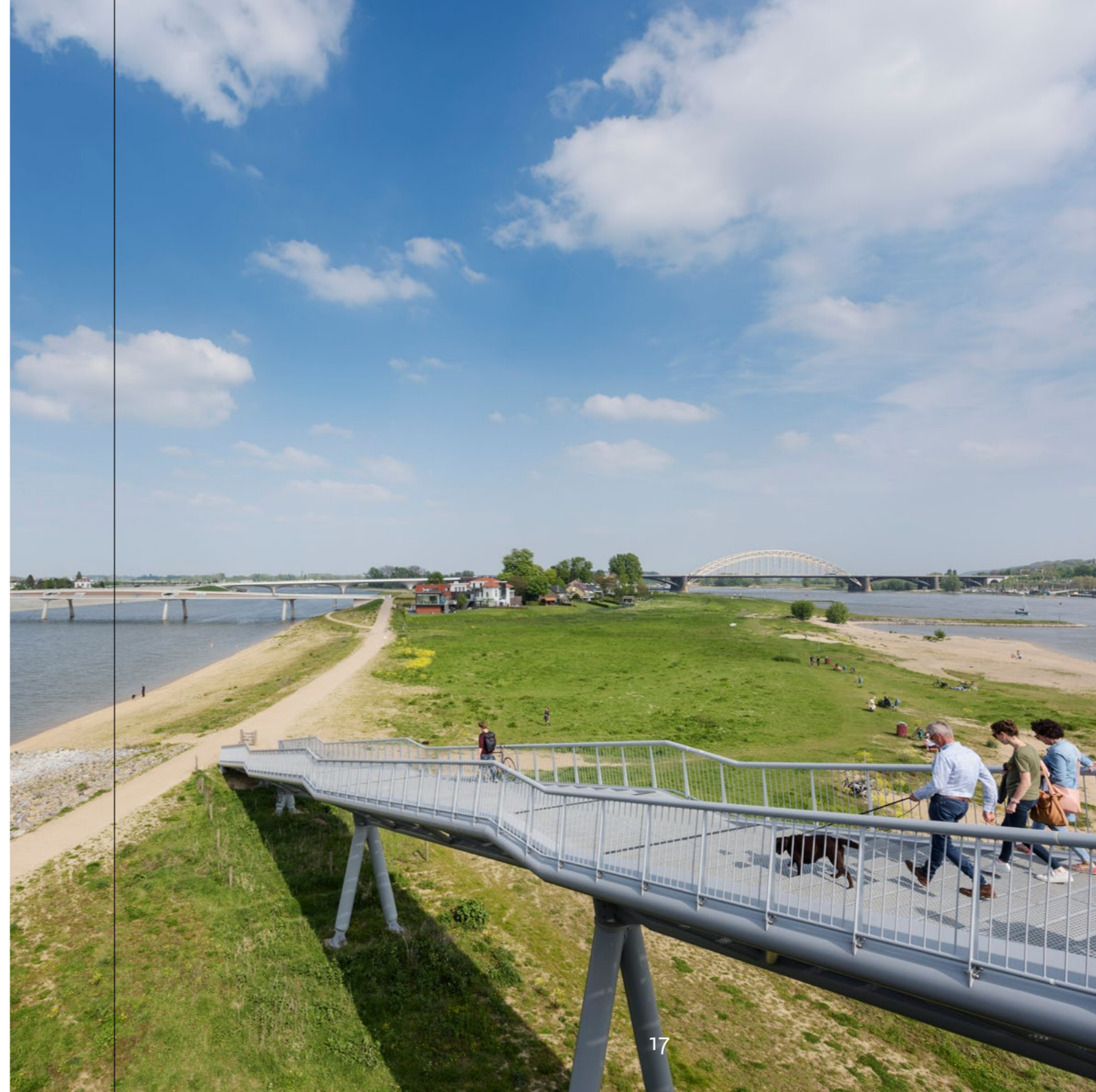
Voorbeeld van een Ruimte voor de Rivier-project: de nevengeul bij Nijmegen-Lent. Bij hoogwater zorgt de nevengeul ervoor dat de waterstanden minder hoog oplopen. Rond de geul en het ontstane eiland is een recreatiegebied ontstaan.

Om deze opgaven integraal aan te pakken is het programma Integraal Riviermanagement (IRM) in het leven geroepen. In dit programma werken regionale overheden en het rijk vanuit één gezamenlijke visie samen aan veilige, bevaarbare, vitale en aantrekkelijke rivieren. Ze doen dat met inbreng van maatschappelijke organisaties, kennisinstellingen en andere belanghebbenden. Het uitgangspunt van deze integrale aanpak is dat de ruimte meervoudig wordt gebruikt op een manier die aansluit bij de karakteristieken van het gebied.