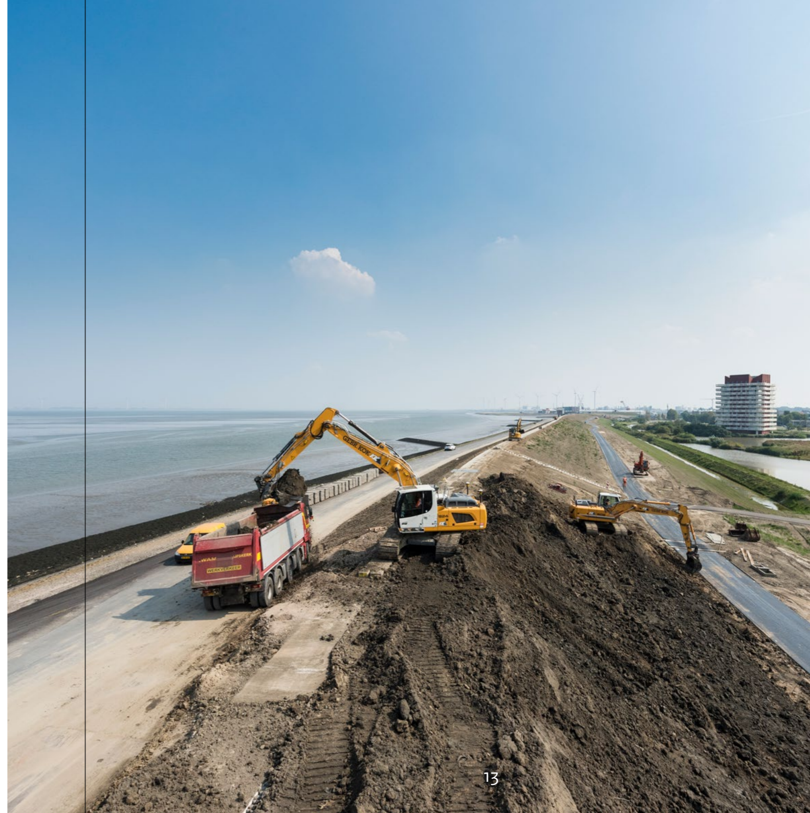
Dijkversterking in uitvoering (2019). De zeedijk bij Delfzijl werd hoger en breder gemaakt en aan de zeezijde versterkt met asfalt en betonblokken. Daarmee is de dijk bestendig tegen aardbevingen.

Als het integrale plan duurder is dan de dijkversterking zonder nevendoelen, moeten de meerkosten uit andere middelen worden gefinancierd.