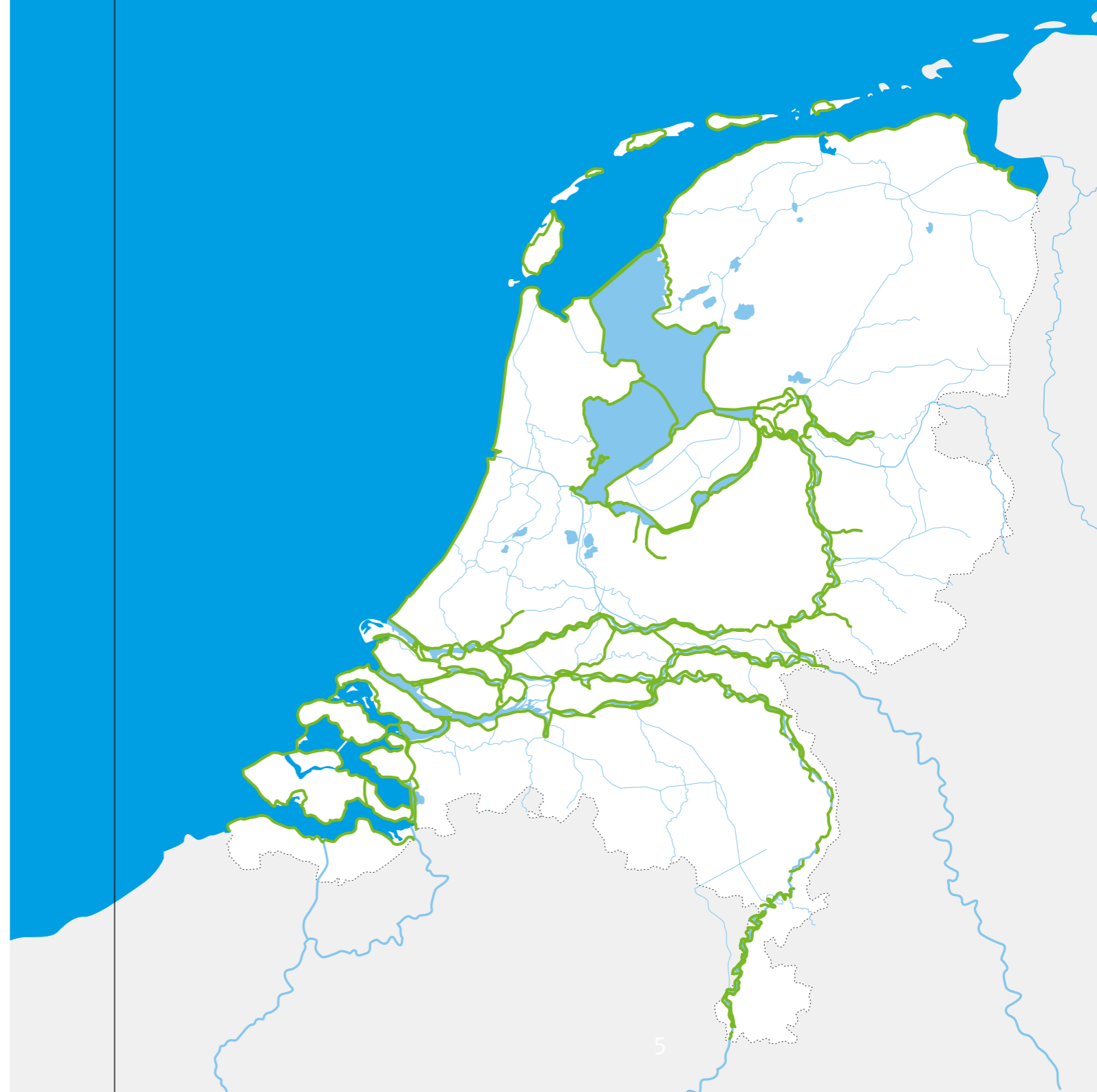
Overzicht van de primaire waterkeringen die ons land beschermen tegen overstromingen vanuit het 'buitenwater', zoals de Noordzee, de Waddenzee, de grote rivieren en het IJssel- en Markermeer.