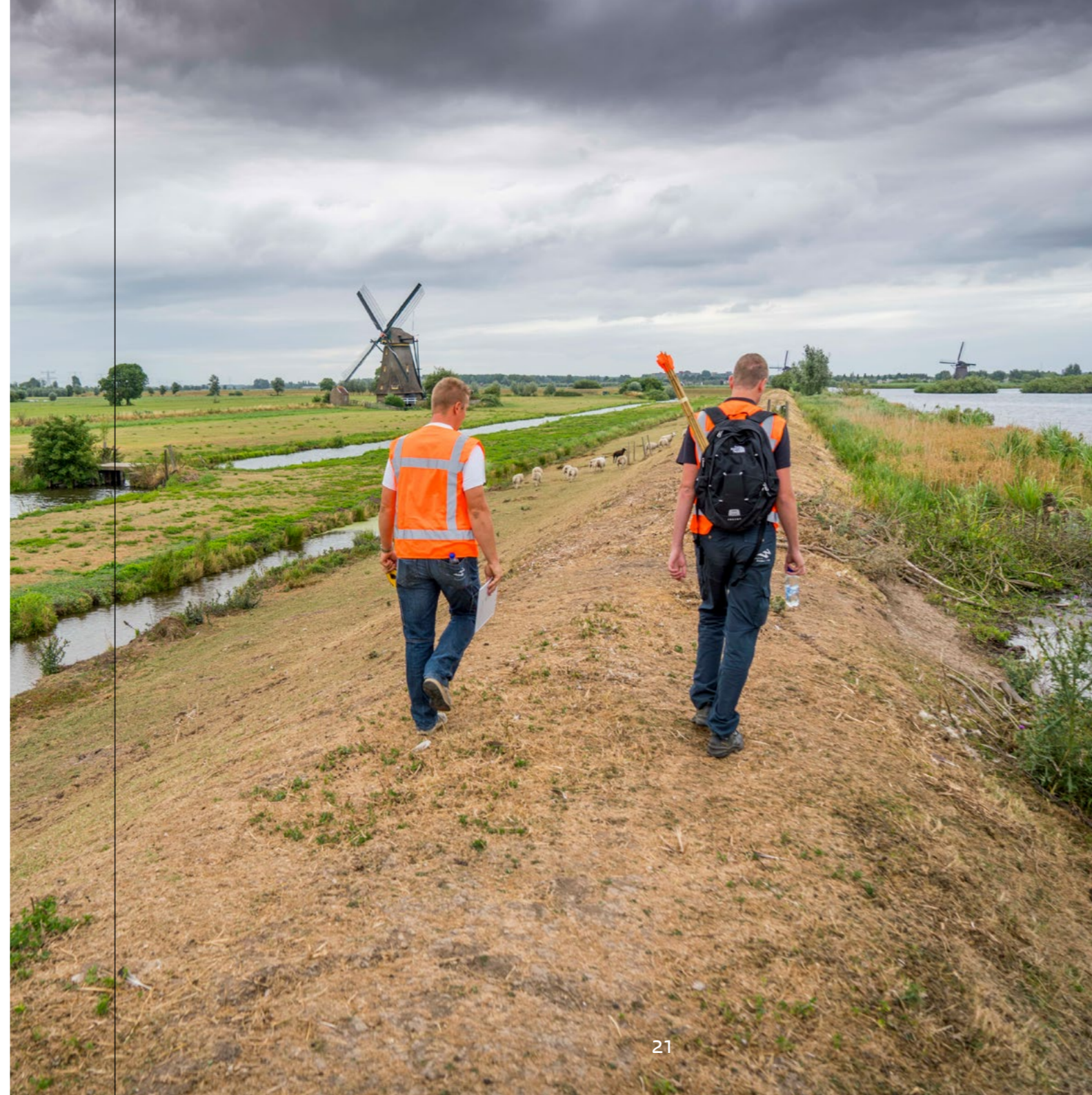
Dijkinspectie door Waterschap Rivierenland op een regionale waterkering bij Kinderdijk. In dit geval werd de dijk gecontroleerd op de aanwezigheid van scheuren door droogte.

Verzamelt zich alsnog veel water in de rivier of beek, dan is het zaak om het water snel af te voeren. Dat kan bijvoorbeeld door het water meer ruimte te geven via een extra geul (bypass).