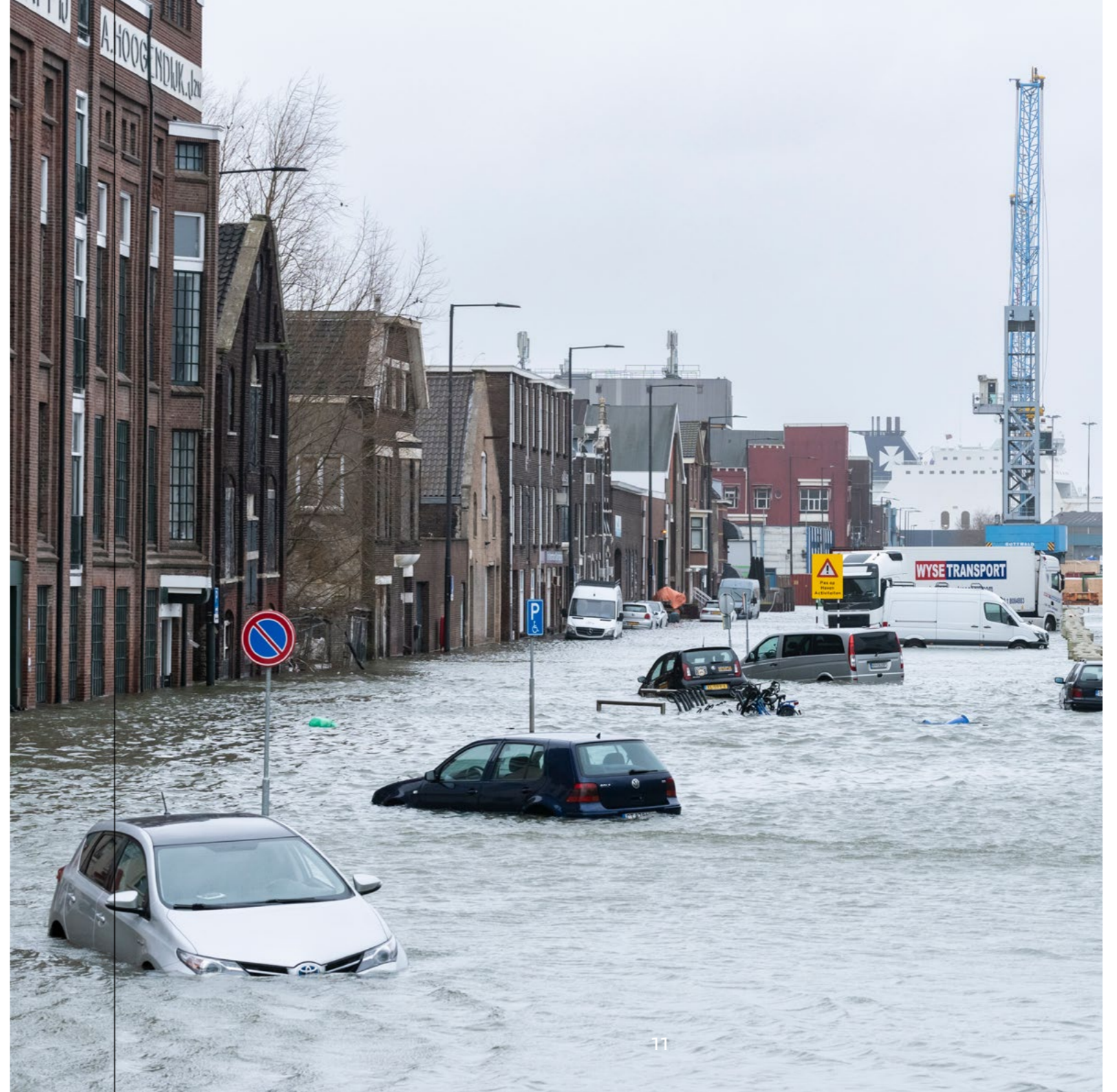
Op 31 januari 2022 woedde storm Corrie over Nederland. Op de foto is te zien hoe buitendijks gebied in Vlaardingen onder water kwam te staan en daarvoor grote wateroverlast zorgde.

In 2023 worden de resultaten van de evaluatie van de Beleidslijn Grote Rivieren (BGR) verwacht. De BGR bevat een kader voor het beoordelen van de toelaatbaarheid – vanuit rivierkundig en ruimtelijk oogpunt – van nieuwe activiteiten in het rivierbed van de grote rivieren. In de actualisatie blijven de buitendijkse gebieden die niet onder de vergunningsplicht vallen van de BGR buiten beschouwing. Denk hierbij aan bijvoorbeeld Drechtsteden en het havengebied van Rotterdam.