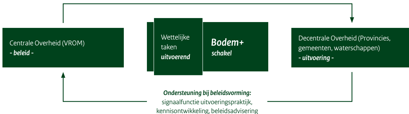
Schematische weergave van de positie van Bodem+ en bijbehorende schakelrol en uitvoerder van wettelijke en centrale (VROM) taken

Ondersteuning bij implementatie en uitvoering: advisering, communicatie, kennisdeling en -verspreiding