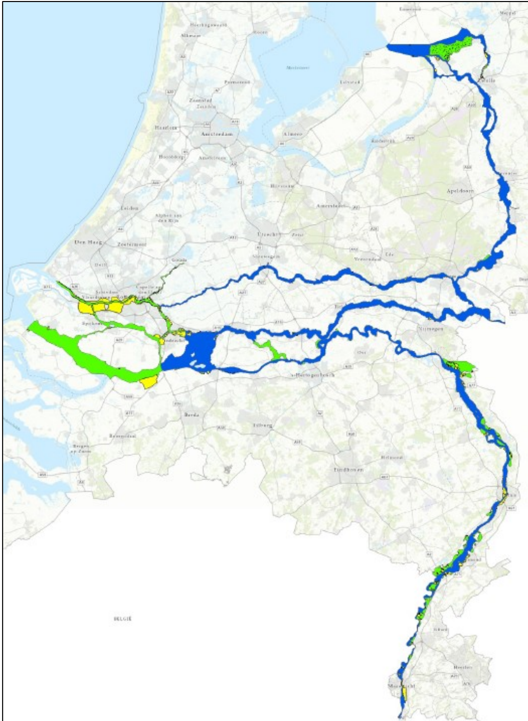
Figuur 1 Begrenzing toepassingsgebied Beleidsregels grote rivieren vanaf 1 juli 2020 (met in blauw het stroomvoerend regime, in groen het bergend regime en in geel de gebieden die zijn vrijgesteld van vergunningplicht)