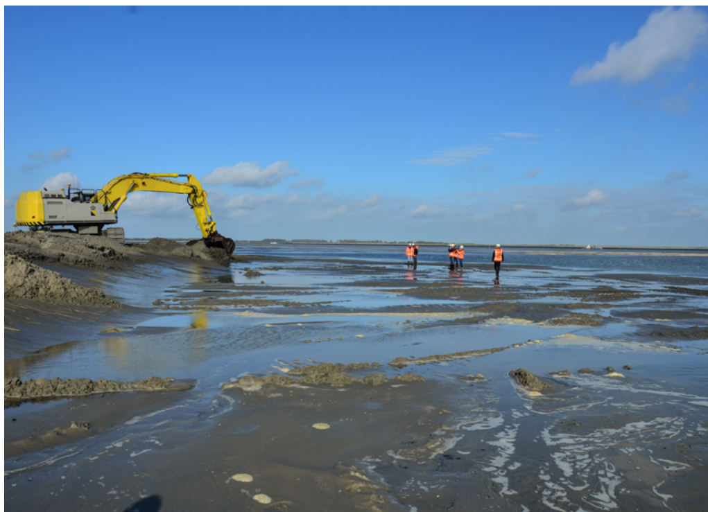
De Roggenplaat is in 2019 met zand gesuppleerd.

De zandsuppletie van de Roggenplaat is opgeleverd. Daarmee hebben we een eerste stap gezet in de bestrijding van de zandhonger in de Oosterschelde. Daarnaast is geconstateerd dat er bij de betrokken partijen nog veel onduidelijkheid bestaat over het toekomstperspectief voor het Volkerak-Zoommeer. Daarom is besloten om in een gebiedsproces eerst zo'n gezamenlijk toekomstperspectief uit te werken voor natuur en ecologische waterkwaliteit. Pas daarna kan een eventuele planstudie van start. Los daarvan zijn regio en rijk in gesprek over een klimaatrobuste zoetwatervoorziening van het gebied. Voor het project Getij Grevelingen hebben het ministerie van