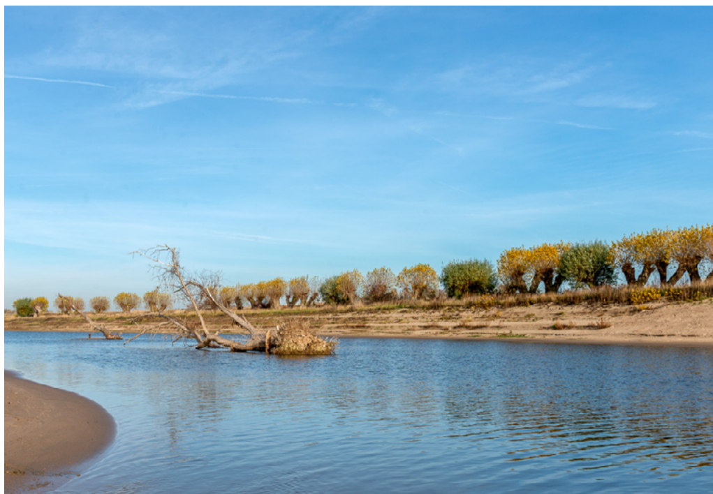
Rivierhout geplaatst in de Heesselsche Uiterwaarden.