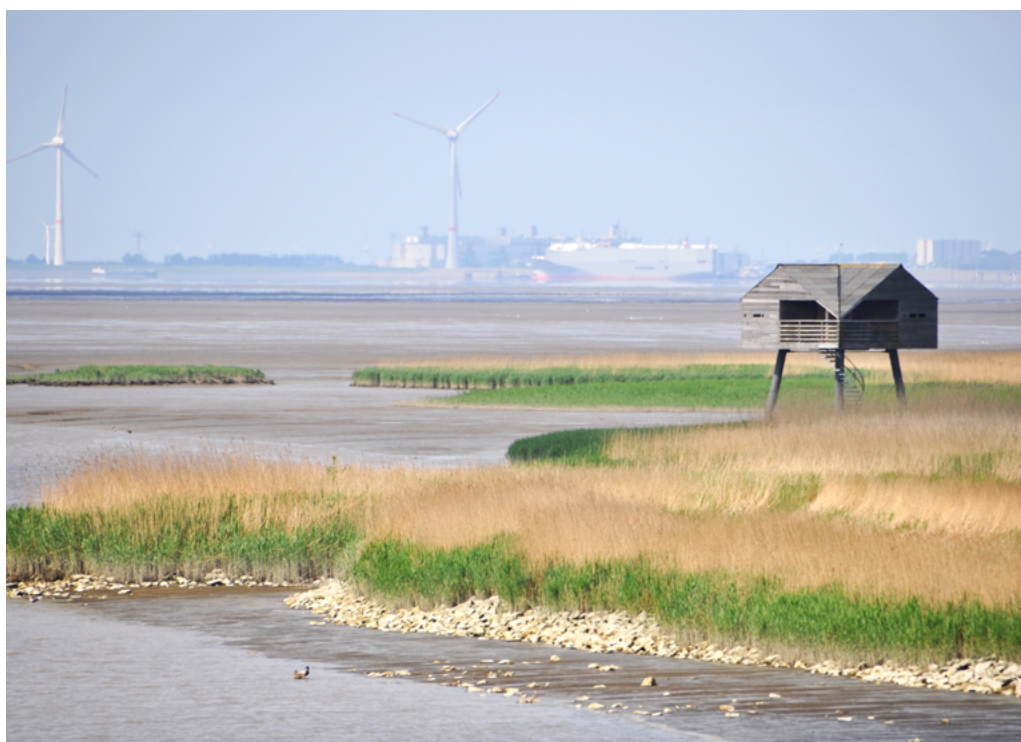
Buitendijkse vogelkijkhut met zicht op de Dollard.

In 2019 hebben we stappen gezet in de concretisering van de ruimtelijke opgave voor natuur en ecologie in het rivierengebied. Zo is er een vooronderzoek gestart naar hoe we natuurdoelen mee kunnen koppelen bij de hoogwaterveiligheidsprojecten Paddenpol en Meanderende Maas.